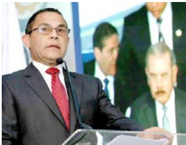
Rafael Ovalles, director general del INFOTEP

El moderno edificio sumará a la Gerencia Regional Central, cinco talleres, 12 aulas equipadas con nuevas butacas, un salón para facilitadores y un salón multiuso, lo que permitirá beneficiar a más usuarios. Mientras que el confortable edificio ubicado en Santiago, consta de tres niveles y uno soterrado de parqueos que servirán de apoyo al centro tecnológico de la Gerencia Reginal Norte.